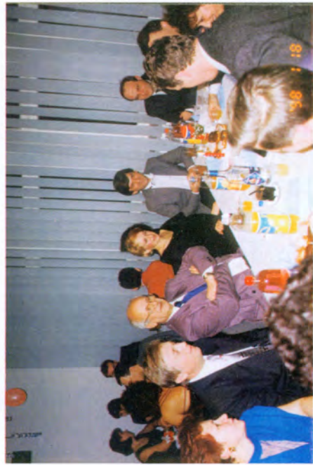
Spotkanie Noworoczne '98