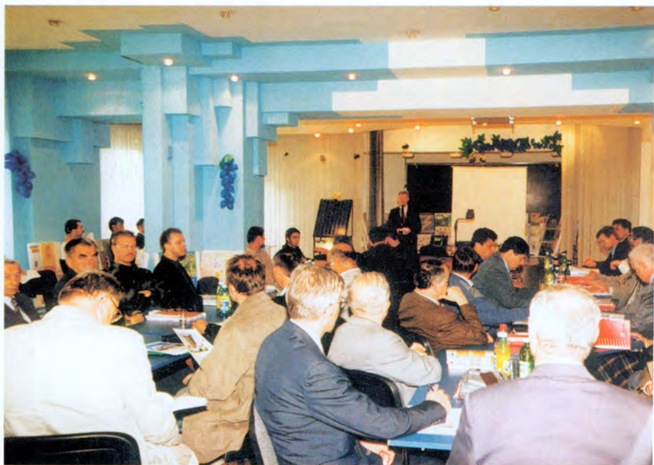
Tarnowskie Dni Elektryki '2001