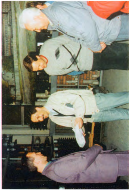
Zakład Porcelany Elektrotechnicznej w Boguchwale '95