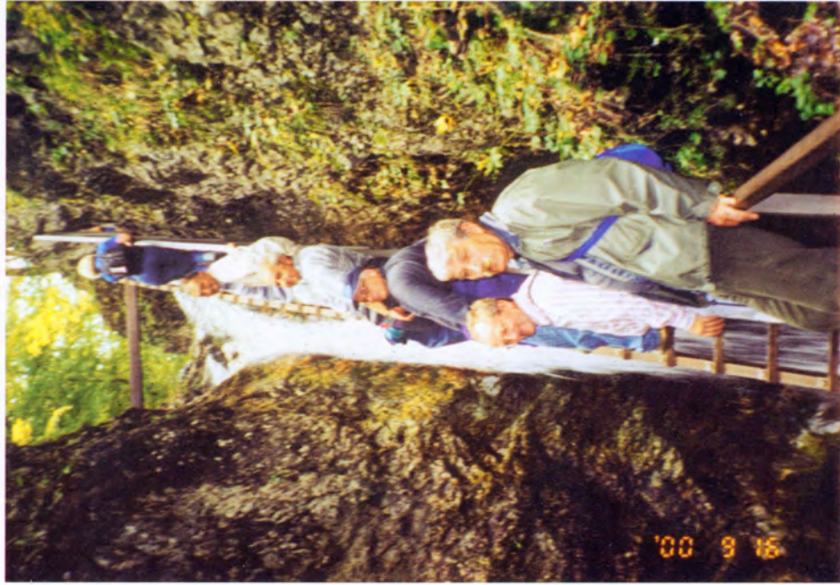
Janosikowe Diery '2000