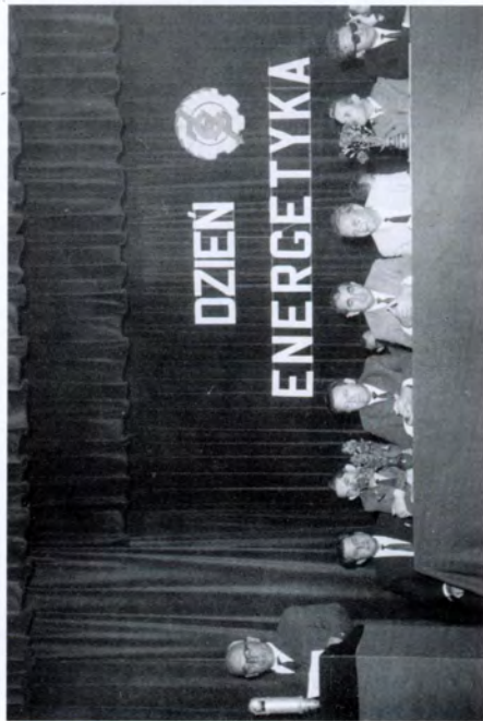
Dzień Energetyka '75