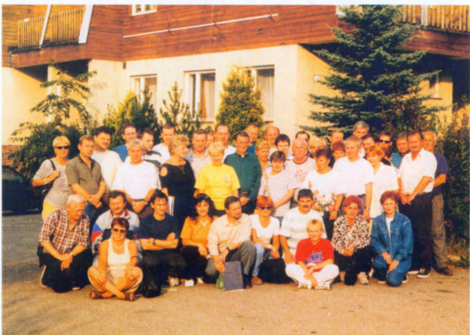
Uczestnicy wycieczki Słowacja '99