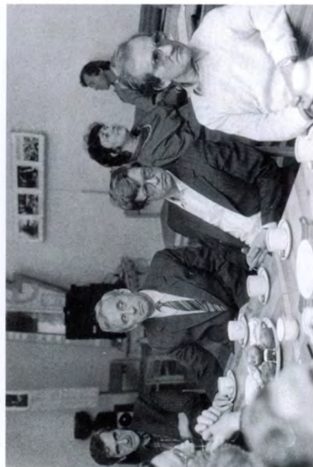
Wybory Zarządu OT SEP '90