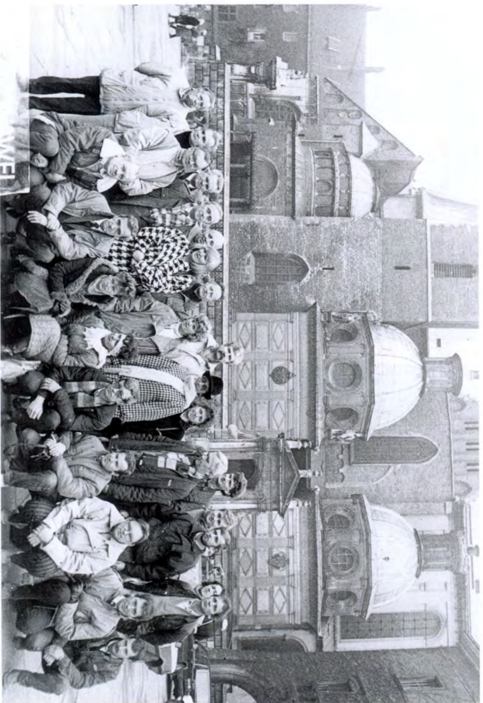
Wycieczka do Krakowa '89