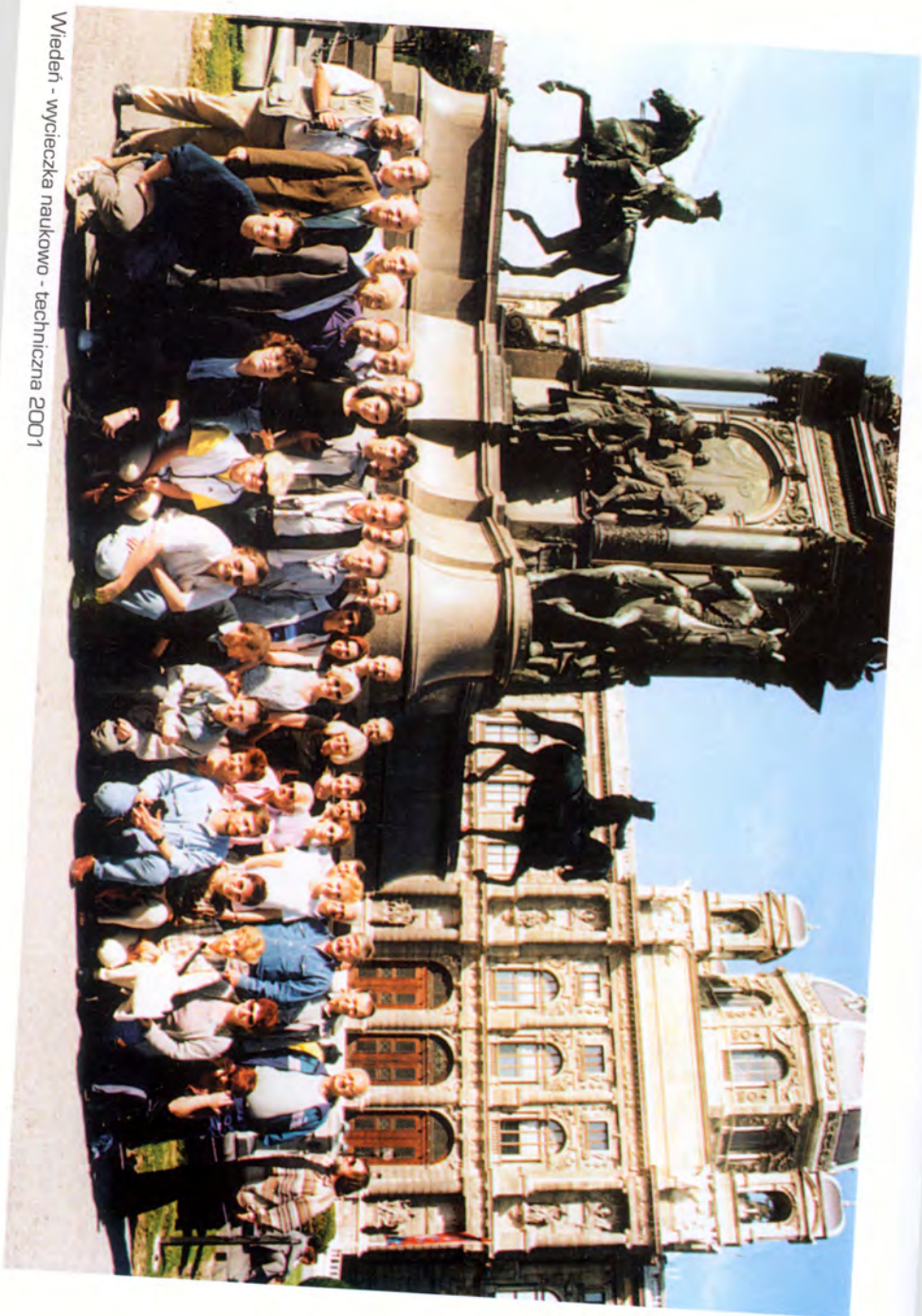
Wiedeń - wycieczka naukowo - techniczna 2001