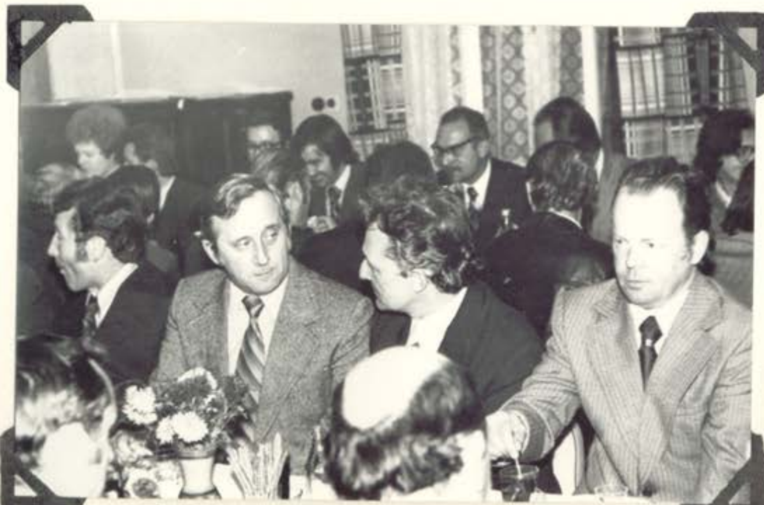
Fragment sali w czasie spotkania przy lampce wina.