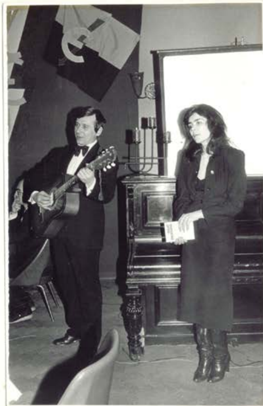
Poezja i śpiewem aktorzy wprowadzili nastrój zadumy i nostalgii.